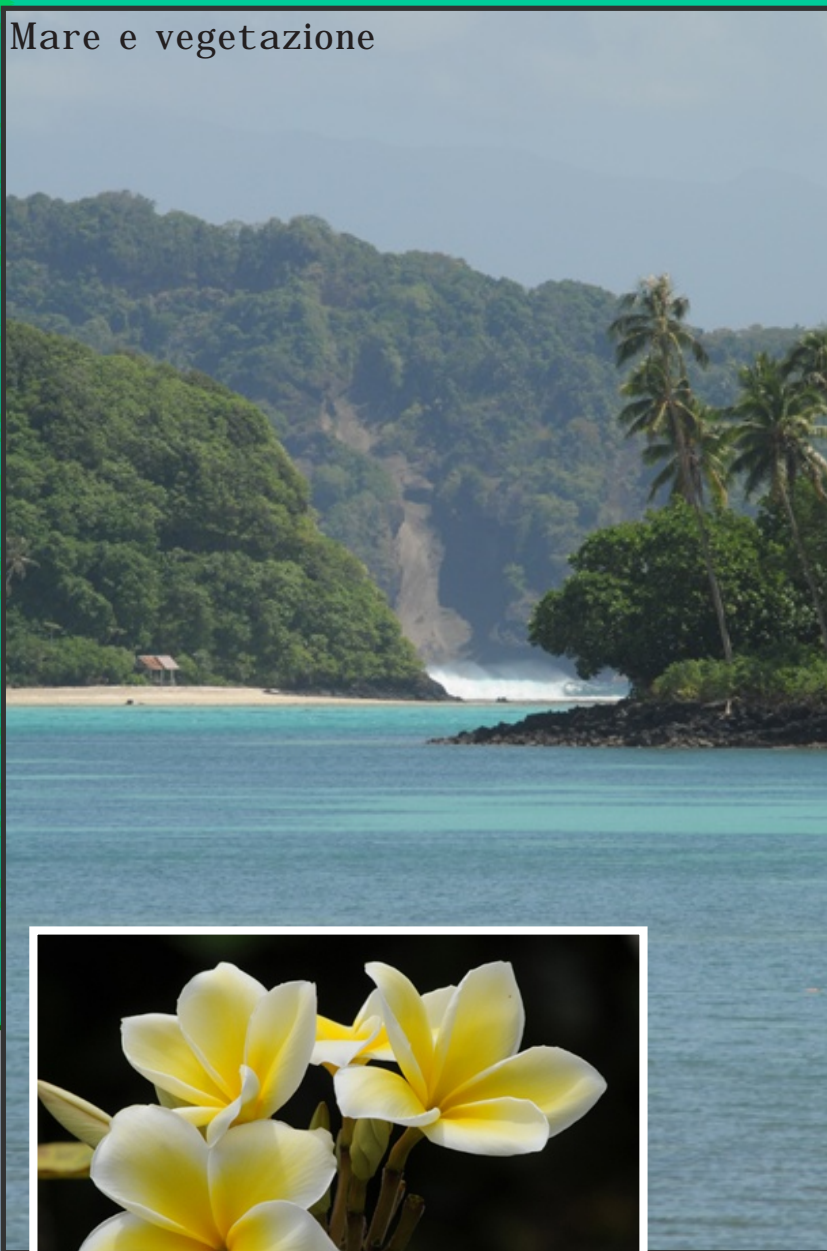
Mare e vegetazione

Sulla cima troverete la tomba di un importante capo di nome Afutiti, sepolto in posizione eretta in modo che potesse continuare a sorvegliare l'isola.